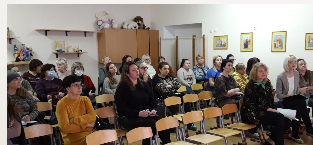
Таблица 1. ГТГ в цифрах