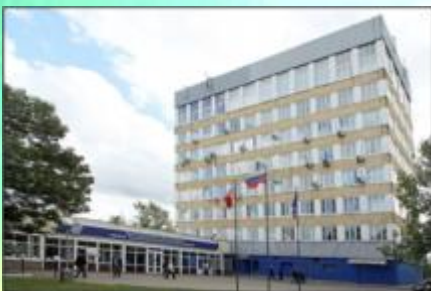
ОАО «Смоленский полиграфический комбинат»