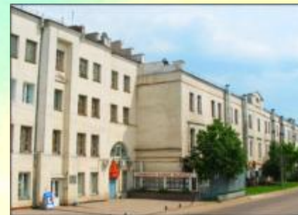
ЗАО «Смоленская Чулочная Фабрика»