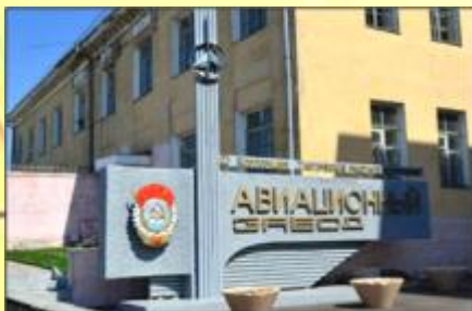
АО «Смоленский авиационный завод»