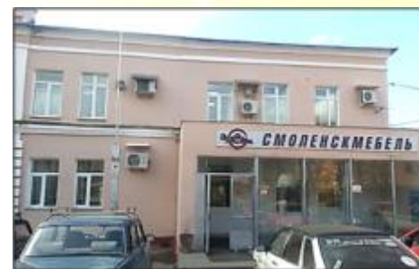
АО «Смоленская мебельная фабрика»