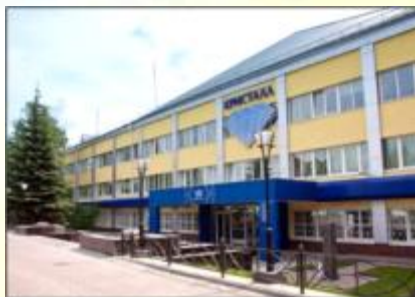
ОАО «ПО Кристалл»