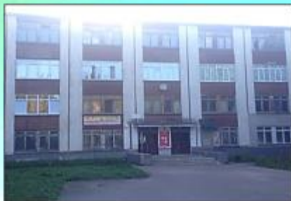
Фабрика «Смоленская игрушка»