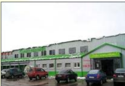
ОАО «Смоленская обувная фабрика»